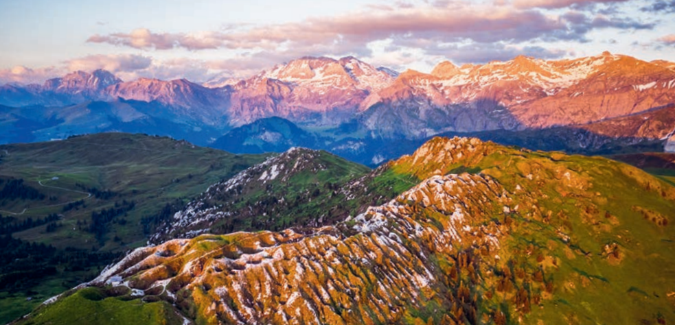
Die Krater der Gryde, dahinter führt der Weg zur Bergstation.