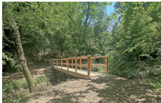
EINE DER ZWEI NEU GEBAUTEN HOLZBRÜCKEN