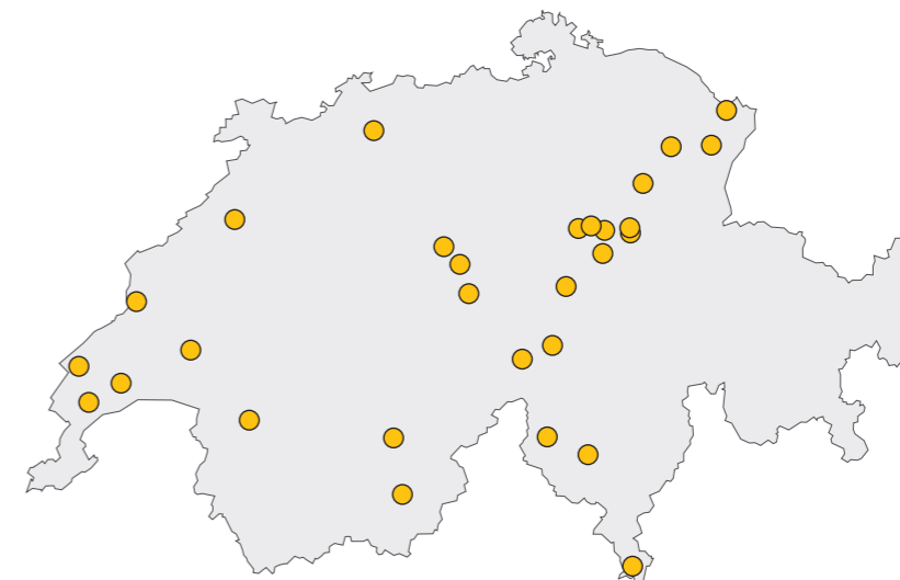
STANDORTE DER 2025 DURCH DEN WANDERWEG-FONDS UNTERSTÜTZTEN WANDERWEGPROJEKTE

SCHWEIZER-WANDERWEGE.CH/WANDERWEG-FONDS PRIXRANDO.CH