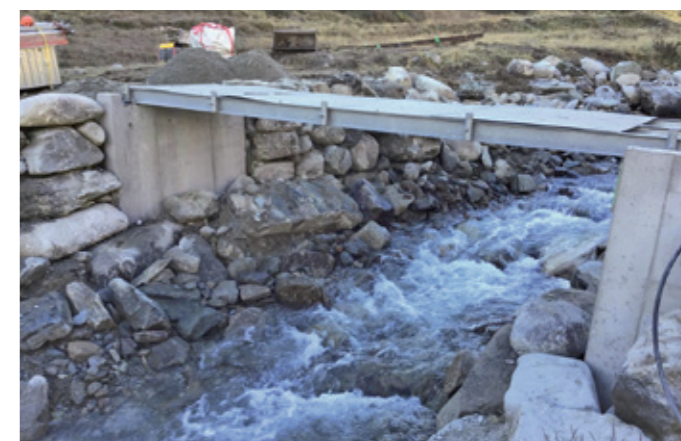
NEUE, MOBILE BRÜCKE MIT BETONFUNDAMENTEN

Der Wanderweg-Fonds wurde 2014 auf Basis einer Grossspende an die Schweizer Wanderwege gegründet. Seither wurden damit über 180 Wanderwegprojekte unterstützt. Projekte, die die Qualitätsziele für Wanderwege auf besonders herausragende Weise erfüllen, werden alle zwei Jahre mit dem Prix Rando ausgezeichnet. Die nächste Preisverleihung findet im September 2026 im Rahmen des Schweizer Wandergipfels in Saanen bei Gstaad statt.