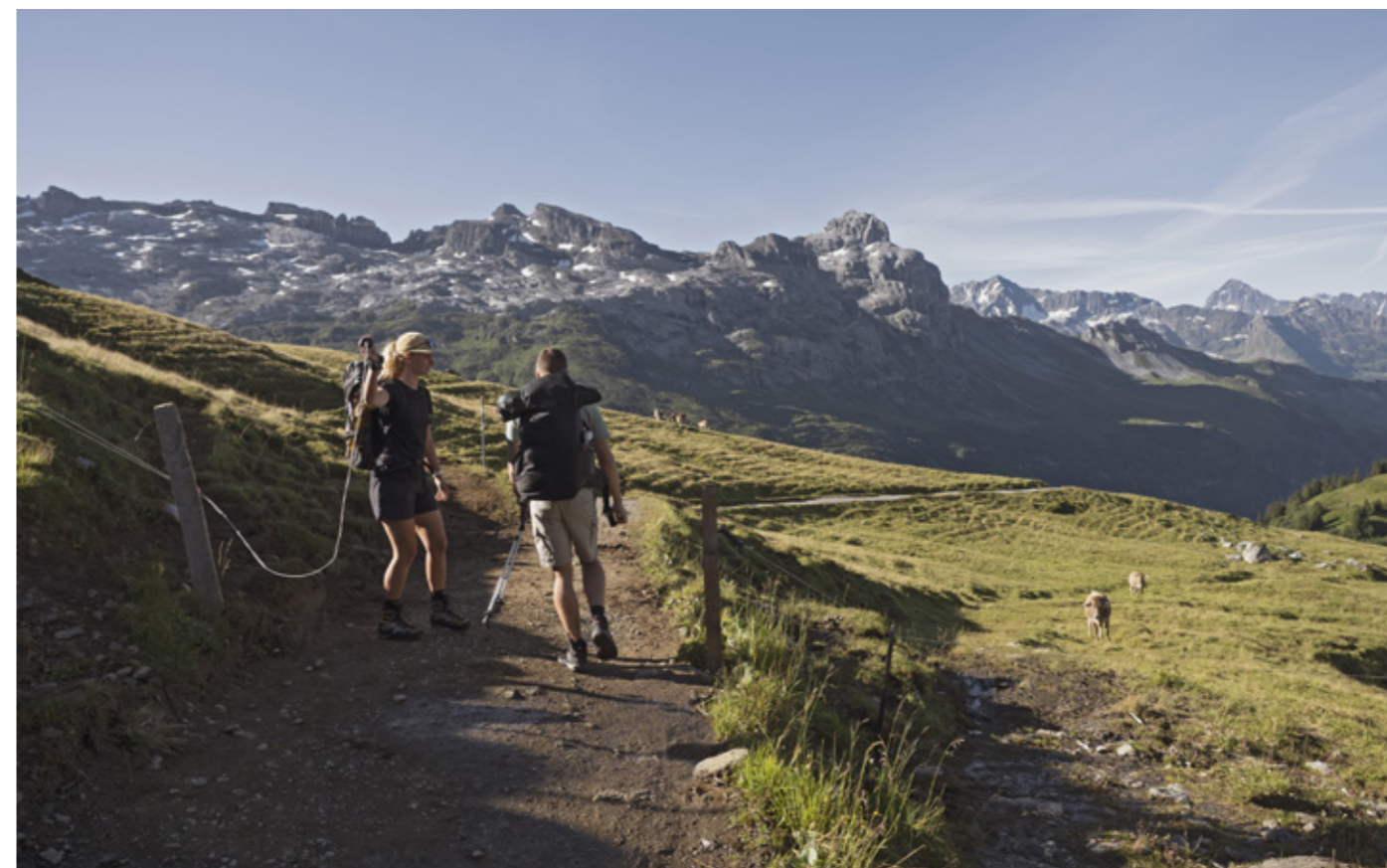
ZAUNDURCHGÄNGE SOLLTEN BEIM DURCHQUEREN EINER WEIDE WIEDER GESCHLOSSEN WERDEN.

Etwa 26 000 Kilometer Wanderwege führen in der Schweiz über Wiesen und Weiden. Mit der Zunahme der Mutterkuhhaltung und dem Einsatz von Herdenschutzhunden häufen sich Begegnungen