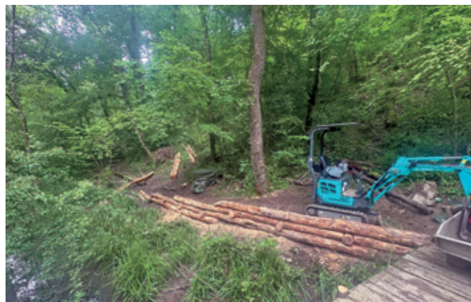
STÜTZUNG DES EROSIONSGEFÄHRDETEN WEGS

Im unteren Mendrisiotto, nahe der Grenze zu Italien, liegt der Park Valle della Motta – eine Ruheoase inmitten des dichten Siedlungsgebiets. Entsprechend wird der Park von Einheimischen wie auch von Touristinnen und Touristen rege besucht. Die hohe Besuchsfrequenz und mehrere Extremwetterereignisse haben ihre Spuren hinterlassen und insbesondere die Wege entlang der Ufer des Roncaglia in Mitleidenschaft gezogen. An einem seiner Nebenarme wurde ein Abschnitt von rund 400 Metern mithilfe der Mittel aus dem Wanderweg-Fonds saniert. «Die Arbeiten waren nötig, um den Zugang zum Park und die Sicherheit der Besucherinnen und Besucher zu gewährleisten», erklärt Martino Cattaneo, Verantwortlicher Wanderwege bei Mendrisiotto Turismo. Konkret wurden zwei baufällige Holzbrücken ersetzt, morsche Treppenstufen ausgetauscht, erodierte Wegoberflächen gestützt und instabile Bäume entfernt. Um die Entwässerung zu verbessern und so die Qualität der Strecke langfristig sicherzustellen, wurden steile Passagen abgetragen und der Neigungswinkel des Wegs angepasst. «Bei der Umsetzung wurde speziell auf naturverträgliche Lösungen geachtet, um damit auch den Vorgaben des kantonalen Amtes für Natur und Landschaft zu entsprechen», merkt Martino Cattaneo an. Der Wanderweg-Fonds hat das Projekt mit 19 500 Franken unterstützt.