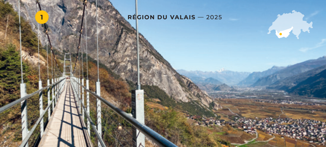
De la Passerelle à Farinet, vue plongeante sur la vallée du Rhône