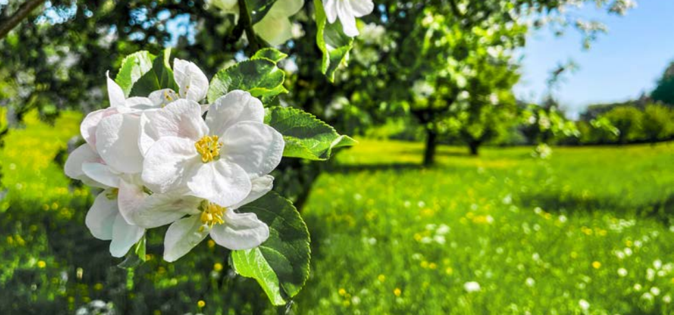
Ein spät blühender Obstbaum auf der Schön matt.