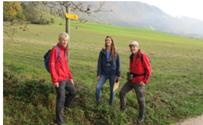
IL PERSONALE TECNICO DI SENTIERI SVIZZERI E SOLOTHURNER WANDERWEGE DURANTE UN SOPRALLUOGO

Come fiore all'occhiello della Svizzera quale destinazione escursionistica, la rete soddisfa le esigenze di un ampio pubblico e comprende sia tranquille escursioni giornaliere sia escursioni a lunga distanza di più giorni. Gli itinerari si distinguono per temi particolari o peculiarità regionali. Fanno inoltre parte dell'offerta 86 sentieri senza barriere per persone con mobilità ridotta.