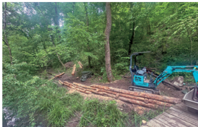
CONSOLIDAMENTO DEL SENTIERO A RISCHIO DI EROSIONE