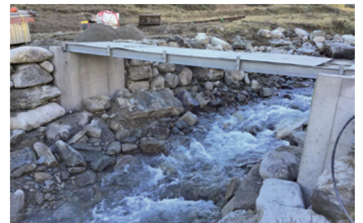
NUOVO PONTE MOBILE CON FONDAZIONI IN CALCESTRUZZO

Il Fondo per progetti di sentieri è stato istituito nel 2014 sulla base di una cospicua donazione a Sentieri Svizzeri. Da allora sono stati sostenuti oltre 180 progetti di sentieri escursionistici. I progetti che soddisfano in modo particolarmente eccellente gli obiettivi di qualità previsti per i sentieri escursionistici vengono premiati ogni due anni con il Prix Rando. La prossima premiazione avrà luogo a settembre 2026 nell'ambito del Vertice svizzero sull'escursionismo a Saanen, vicino a Gstaad.